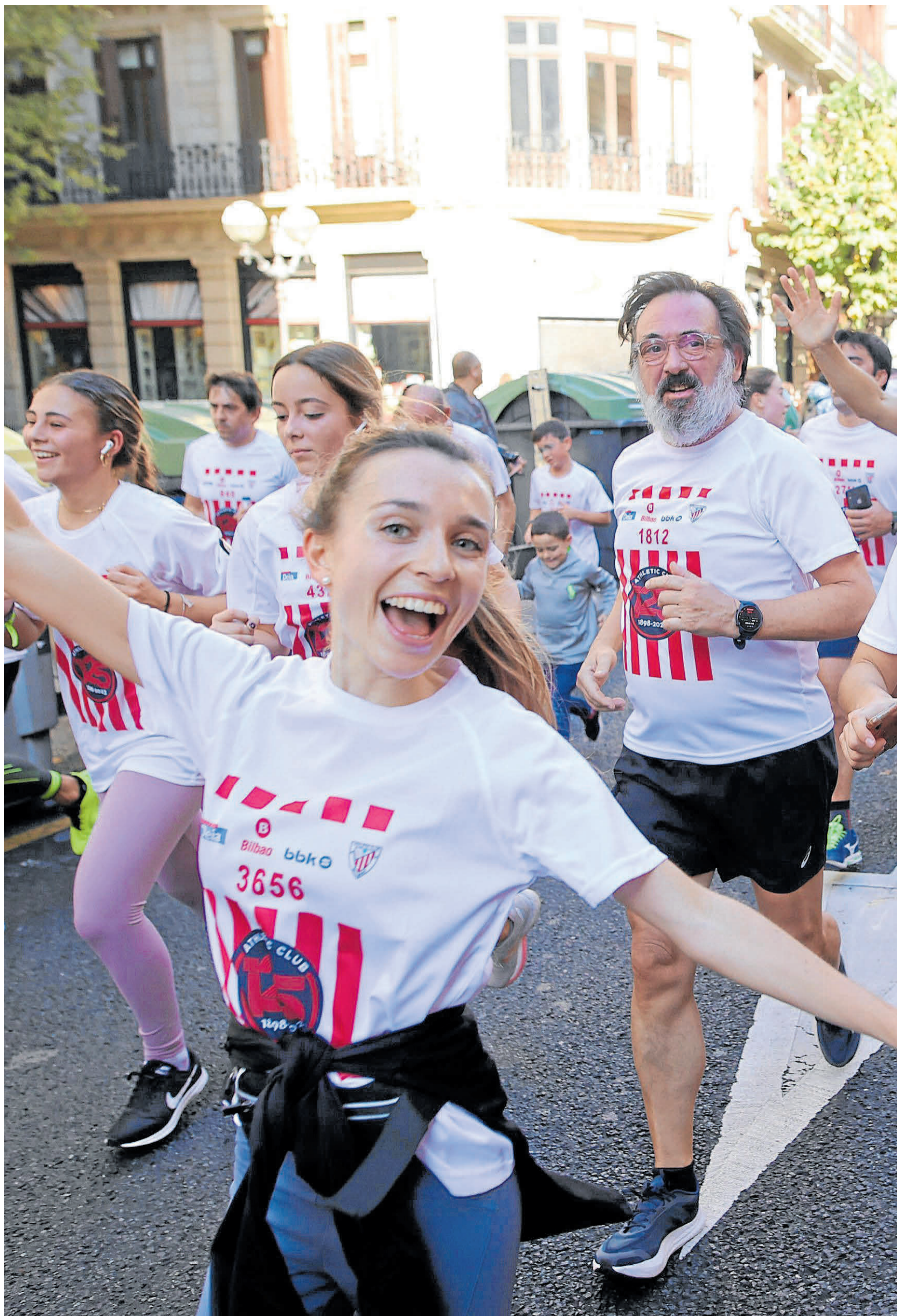
Las principales arterias de Bilbao fueron tomadas por una multitud intergeneracional.

PARTICIPANTES. La 34ª edición de la Herri Krosa fue un éxito de organización y de participantes. 10.000 ganadores se dieron cita en ella, agotando las inscripciones seis días antes de la prueba, gracias sobre todo a San Mamés, que fue el principal reclamo. La afición rojiblanca acudió a la cita con el atletismo, otra forma de celebrar el 125 aniversario del Athletic, gracias sobre todo a la vuelta que se dio sobre el césped de La Catedral, en el quinto kilómetro de la prueba. Es decir, justo en su ecuador.