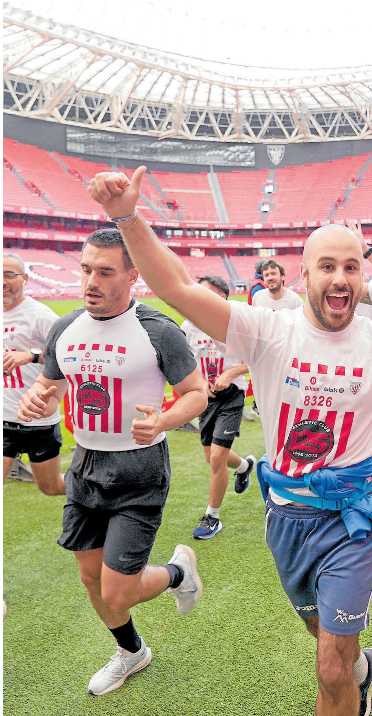
Por unos minutos, el césped de 'La Catedral' cambió el fútbol por el atletismo.