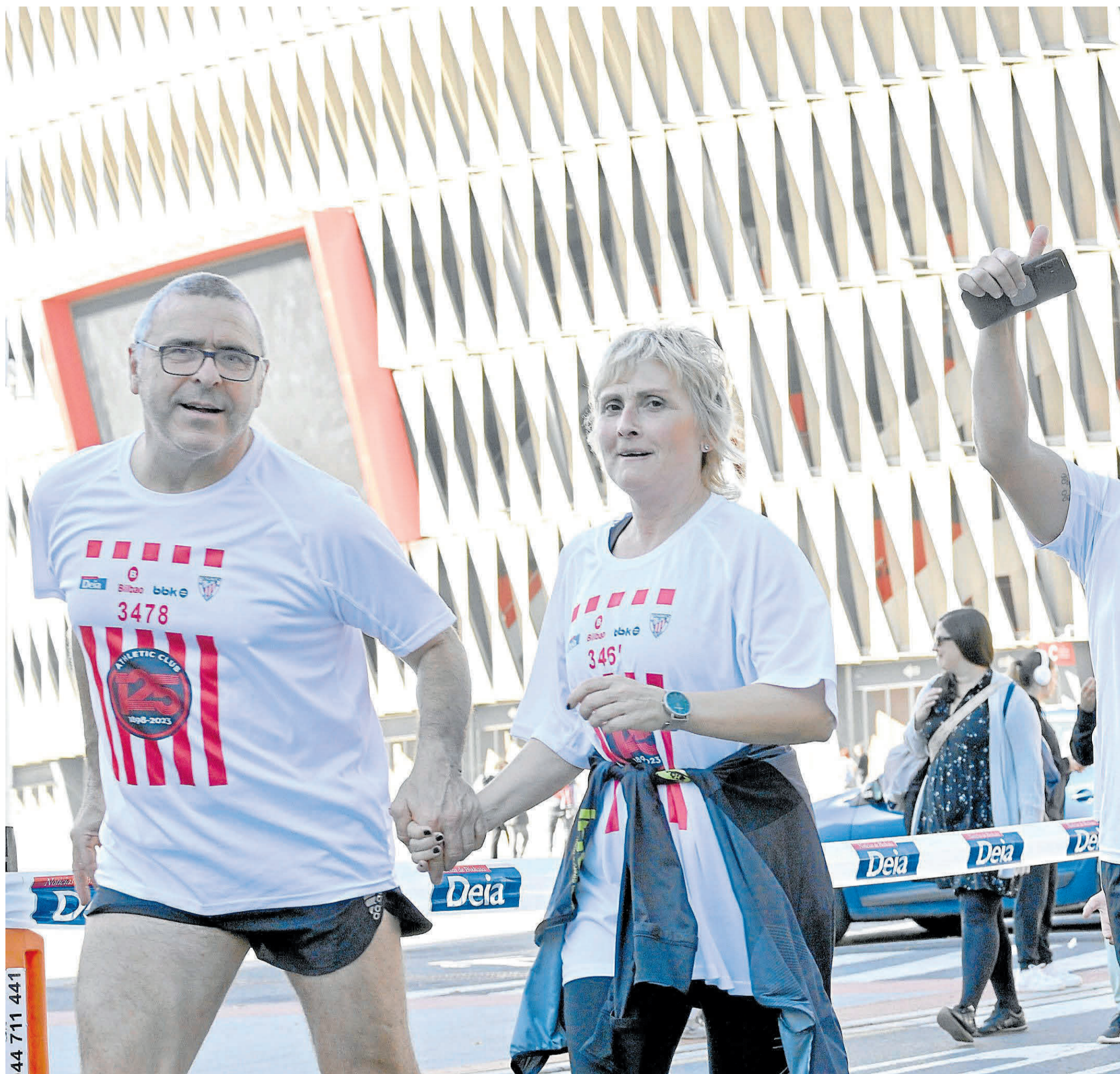
El 125 aniversario del Athletic permitió abrir de par en par San Mamés a los participantes de la Herri Krosa.