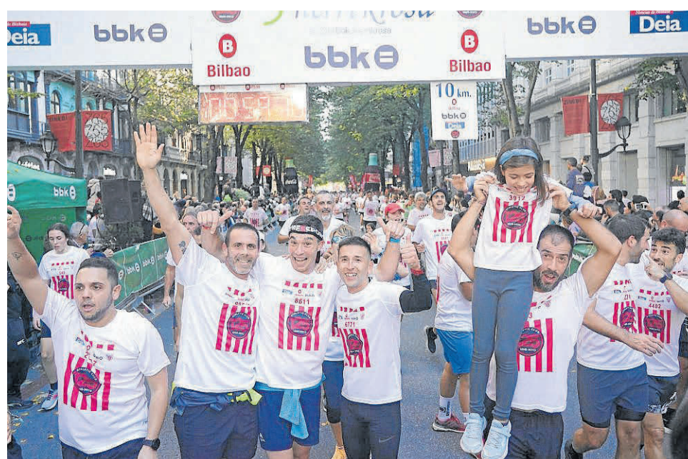
EQUIPO DE LA CRUZ ROJA Bilbao

“Desde la primera edición hasta esta nuestra labor siempre ha sido atender a los participantes y velar por su seguridad”