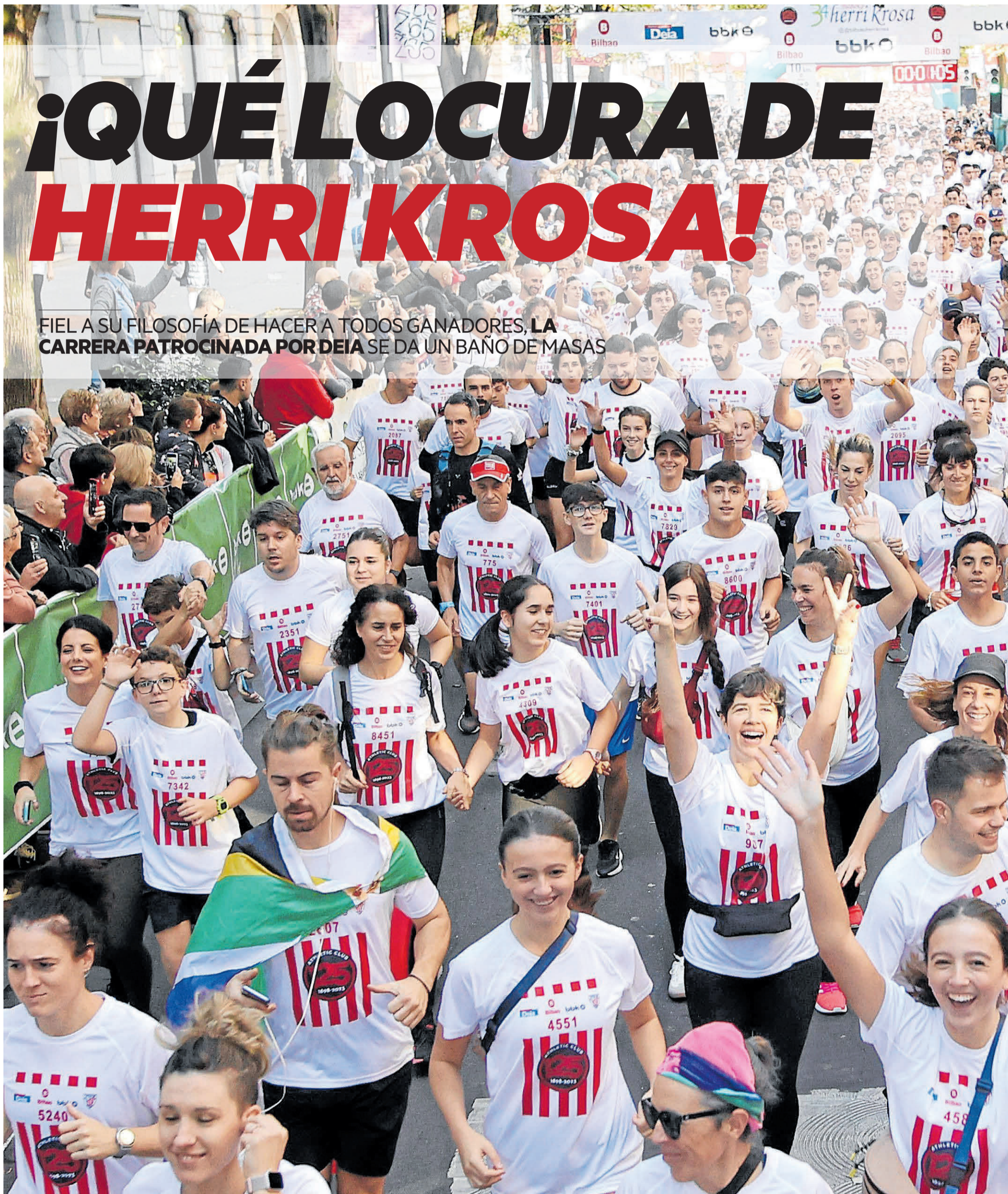
La XXXIV edición de la Herri Krosa se disputó en un ambiente deportivo y festivo.

FIEL A SU FILOSOFÍA DE HACER A TODOS GANADORES, LA CARRERA PATROCINADA POR DEIA SE DA UN BAÑO DE MASAS